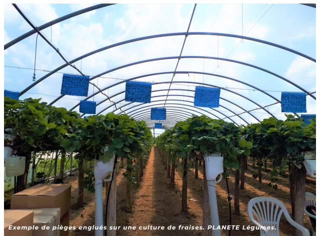
Exemple de pièges englués sur une culture de fraises. PLANETE Légumes.

>> Les panneaux sont généralement situés au-dessus des cultures. Il est nécessaire de veiller à réaliser un éloignement suffisant avec ces dernières pour éviter de piéger les auxiliaires qui sont attirés par ces pièges englués.