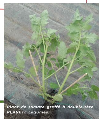
Plant de tomate greffé à double-tête. PLANETE Légumes.

>> Un plant greffé coûte à peu près le double d'un plant franc. Comme une conduite sur double-tête permet de diviser le besoin en plants par deux tout en obtenant le même rendement il n'y a pas de surcoût.