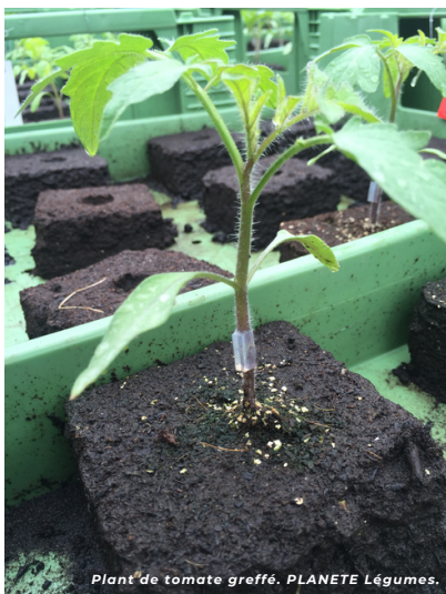
Plant de tomate greffé. PLANETE Légumes.

>> En production sous abri, la fatigue du sol est un problème récurrent, notamment sur les cultures d'été comme le concombre et la tomate. Pour des raisons de place limitée sous les serres, les rotations sont souvent trop courtes sur ces cultures. Ainsi, on observe des grosses pertes de rendement en raison des maladies telluriques comme le Fusarium oxysporum , le Corky root, le mildiou terrestre ou certains nématodes.