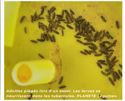
Adultes piégés lors d'un essai. Les larves se nourrissent dans les tubercules. PLANETE Légumes.

>> Le taupin de la pomme de terre (nom commun) est un petit coléoptère dont les larves se nourrissent des tubercules en y creusant des galeries qui déprécient rapidement la qualité du produit.