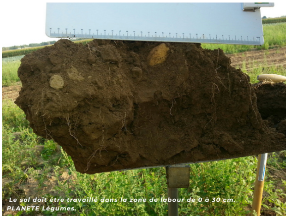
Le sol doit être travaillé dans la zone de labour de 0 à 30 cm. PLANETE Légumes.

>> L'objectif est alors d' exposer les larves au dessèchement en surface ainsi qu'aux prédateurs comme les oiseaux.