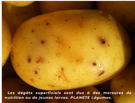
Les dégâts superficiels sont dus à des morsures de nutrition ou de jeunes larves. PLANETE Légumes.