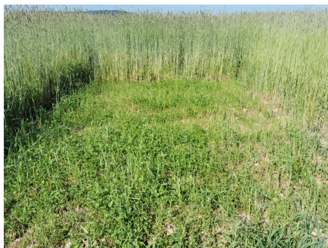
Semis du 24 septembre 2020 avec Seigle Fourrager