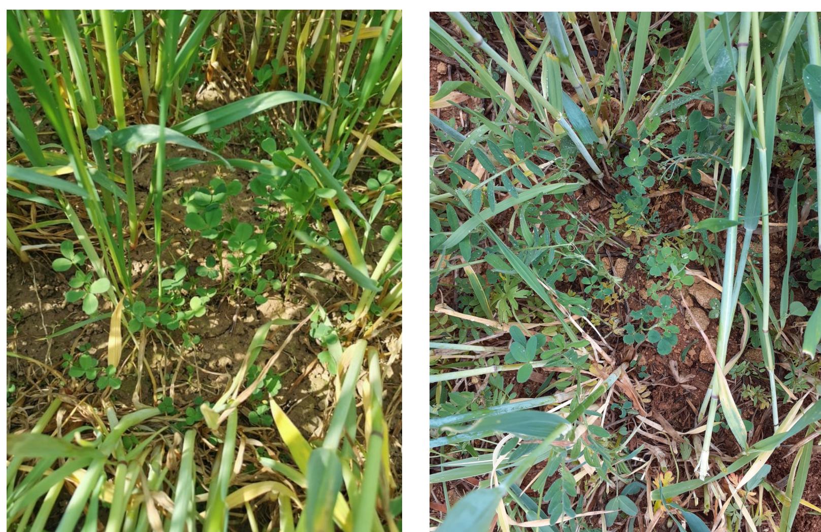
Semis du 20 octobre 2020 avec Triticale/Pois F.